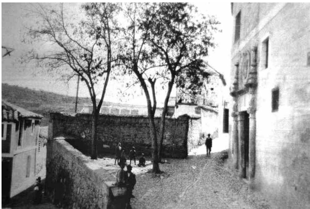
Fig. 1 - Esquina del callejón del Cristo de la Parra (del Horno) y de la calle del Corredorcillo de San Bartolomé: emplazamiento del horno (casa BC-5).

En xii dias del dicho mes de agosto del dicho anno de noventa e un annos, los venerables señores Cristoval de Villaminaya e Alvar Peres de Montemayor canonigos e vesitadores de las posiciones de la santa yglesia de Toledo deslindaron este horno e fallose en el dies varas e media en largo e siete e dos terçias en ancho. De que fueron testigos Diego de Obregon e Diego Serrano criados del dicho sennor Alvar Peres (firmado) Juan de Mayorga notario apostolico.