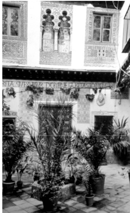
Fig. Callejón del Vicario, n° 4 (casa demolida en la segunda mitad del siglo XX), patio interior neo mudejar